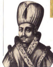
Osman III (1754-1757)