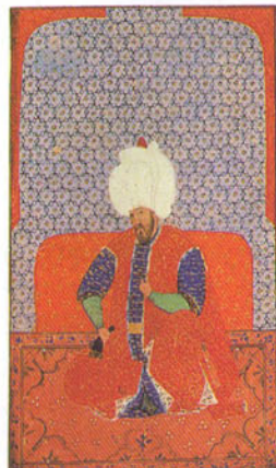
Süleyman I er - le Magnifique - (1520-1566) étend l'empire et favorise les arts et la culture