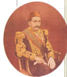
Abdül Hamit II (1876-1909) suspend le parlement et règne en autocrate jusqu'à la révolution pacifique des Jeunes Turcs