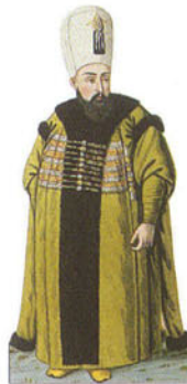
İbrahim - le Fou - (1640-1648) sombre dans la démençe au terme d'un règne court mais désastreux