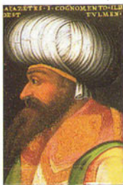
Bayazit I er (1389-1402) est surnommé « la Foudre » pour la vitesse à laquelle il prend ses décisions stratégiques et déplace ses troupes