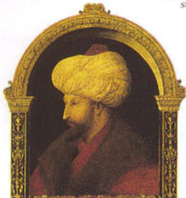
Murat II (1421-1451), le plus grand des sultans guerriers, remporte d'importantes victoires contre les croisés