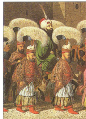
Mahmut II - le Réformateur - (1808-1839) réussit à vaincre les janissaires (p. 127)