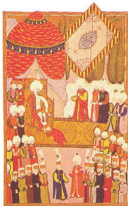
Murat III (1574-1595), dont voici la tuğra (p. 95), engendre plus de 100 enfants