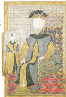
Ahmet III (1703-1730) règne pendant une renaissance culturelle appelée l'époque des Tulipes (p. 25)