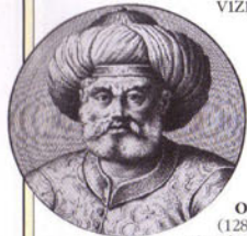
Osman Gazi (1280-1324), un chef de tribu, fonde la dynastie ottomane

Les premiers Ottomans étaient les chefs de tribus vivant aux frontières de l'Empire byzantin. À partir du XIII e siècle, cependant, la dynastie conquiert un vaste territoire. À leur apogée, les sultans ottomans, qui avaient pris Constantinople en 1453 (p. 24), suscitaient l'admiration et la crainte pour leur puissance militaire et leur cruauté envers leurs adversaires. Plus tard, ils menèrent souvent une vie décadente, laissant l'exercice du pouvoir à leurs vizirs (p. 27).