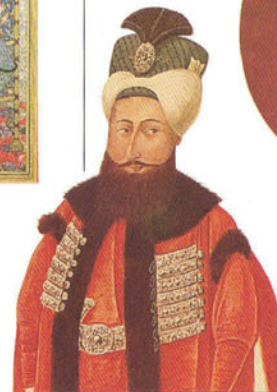
Abdül Mecit II (1922-1923) n'est que calife, le sultanat ayant été aboli en 1922 (p. 29)