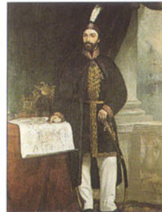
Mehmet VI (1918-1922), le dernier sultan ottoman, est contraint à l'exil par la proclamation de la République (p. 29)