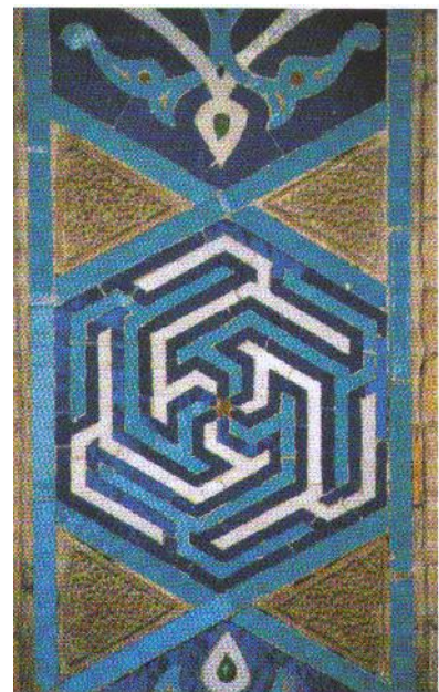
Le nom d'Ali à Kerman