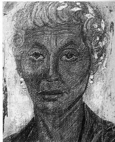
Femme âgée de Panopolis.

De même les personnes âgées sont assez bien représentées. On peut